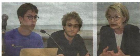
L'Eurodéputée F. Grossetête au Lycée Vaucanson avec 2 jeunes animateurs des Jeunes Européens Isère et du Parlement européen des Jeunes

une rencontre avec Françoise Grossetête :