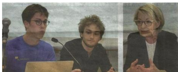
L'Eurodéputée F. Grossetête au Lycée Vaucanson avec 2 jeunes animateurs des Jeunes Européens Isère et du Parlement européen des Jeunes

une rencontre avec Françoise Grossetête :